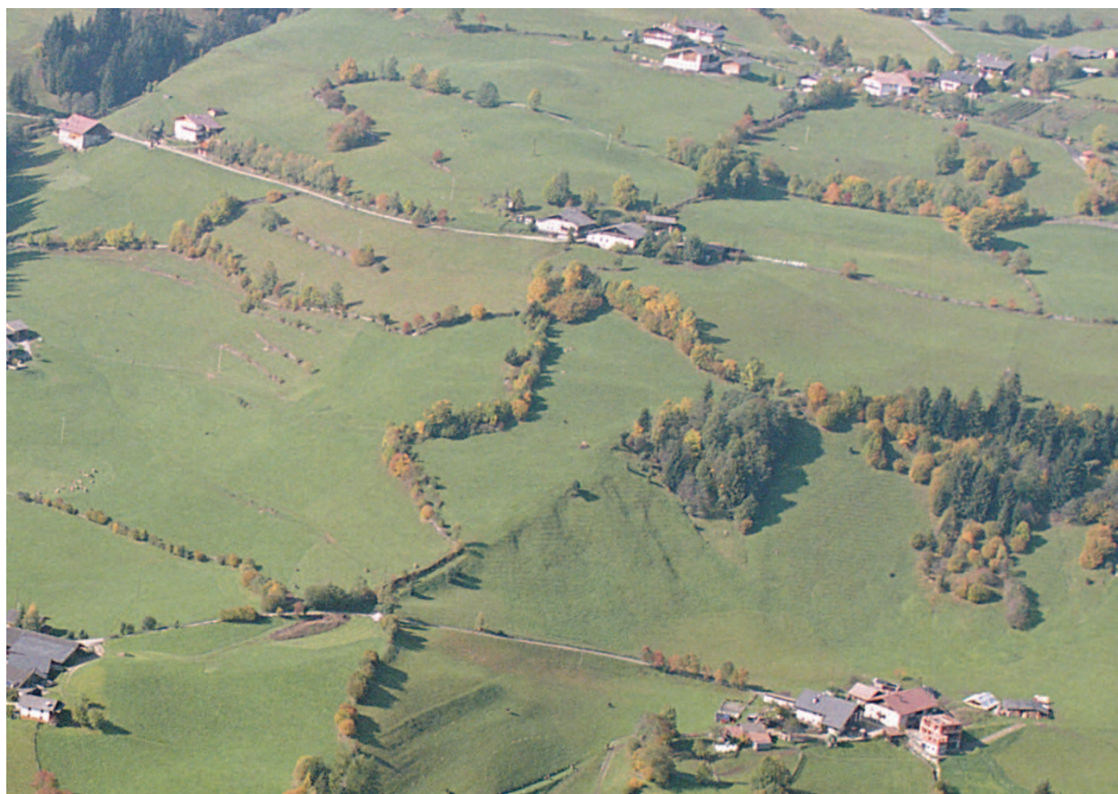
Luftaufnahme – Foto aerea