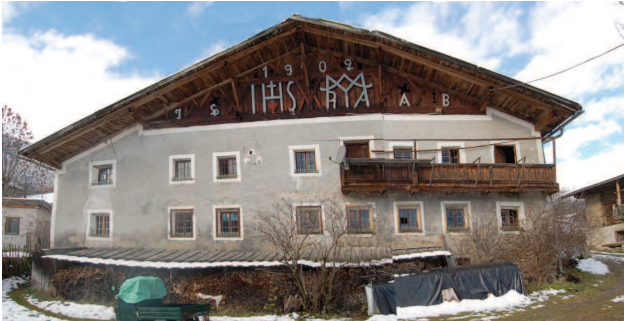
BP Ped 64