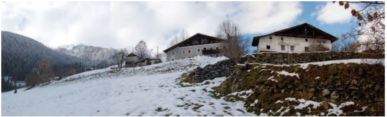
BP Ped 64 - 128